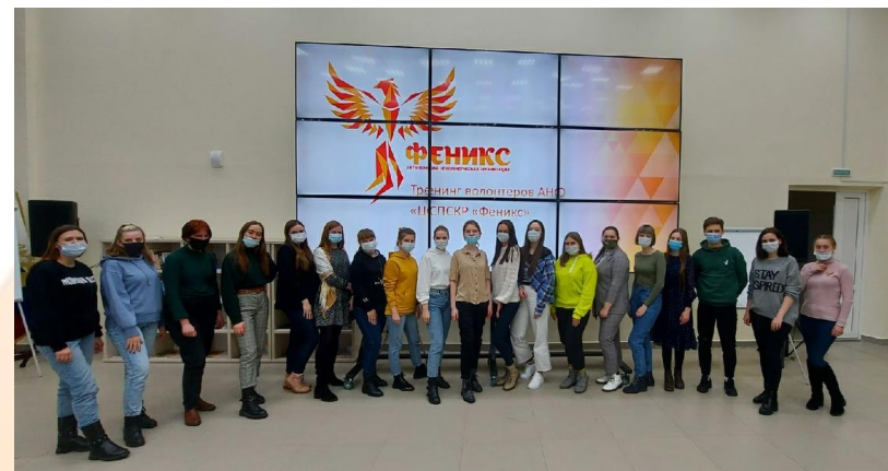
Обучающие тренинги для волонтеров