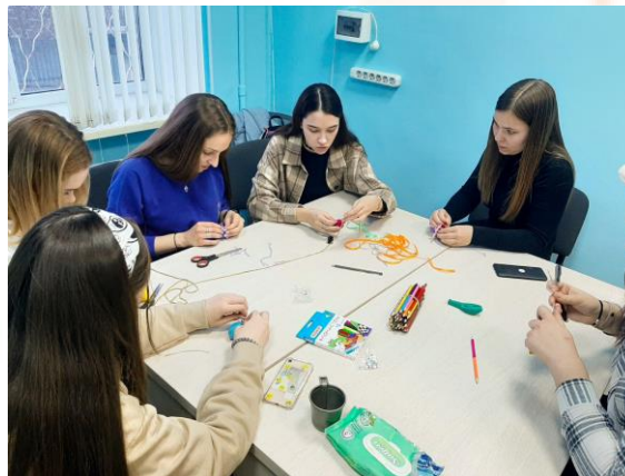
Профилактика выгорания волонтеров

За прошедший год в мероприятиях Феникса приняло участие порядка 45 волонтеров.