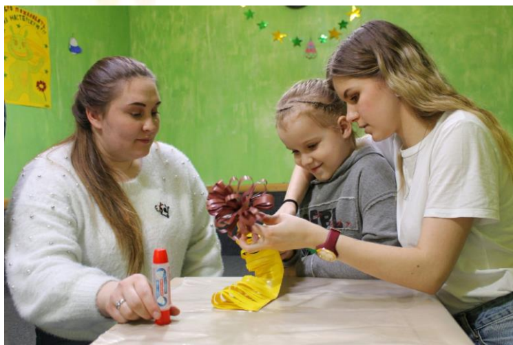
Творческие мастерские для детей